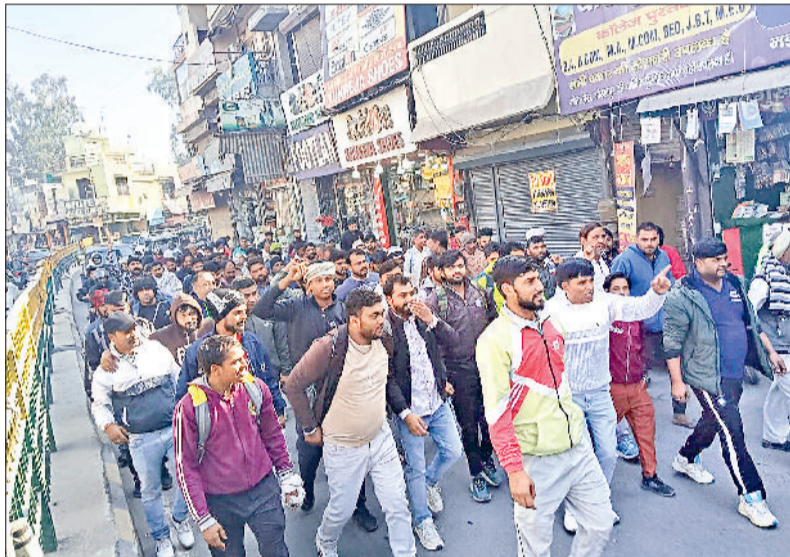
कूड़ा उठाने वाली गाड़ियों के चालकों एवं सहायकों ने रखी अपनी मांगें।