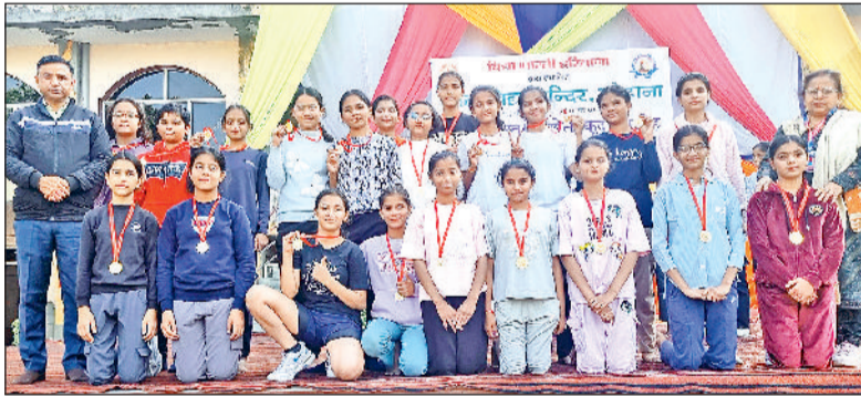
गोहाणा। खेल प्रतियोगिताओं में विजेता विद्यार्थी अतिथियों एवं शिक्षकों के साथ।