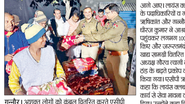
गन्जौर। दातौली गांव स्थित देवो आश्रम में रह रहे मानसिक रूप से अशक्त लोगों की मदद के लिए