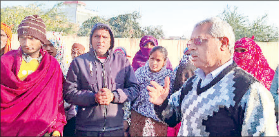
खरखोदा। चेररमेन को अपनी वस्था सुनाते ठेका सफाई कर्मचारी।

पिछले माह का भी वेतन आज तक नहीं मिला, घर का गुजारा चलाना हो रहा मुश्किल