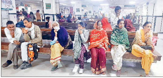
सोनीपत। नागरिक अस्पताल में डॉक्टर का इंतजार करते मरीज।

जिले में चिकित्सकों की हड़ताल का तीसरा दिन भी स्वास्थ्य तंत्र पर भारी रहा। बुधवार को जिला अस्पताल समेत सभी प्रमुख स्वास्थ्य केंद्रों में ओपीडी से लेकर जांच सेवाओं तक व्यापक प्रभाव देखने को मिला। अस्पताल प्रशासन ने बाल रोग, नेत्र रोग और प्रसूति विभाग को छोड़कर अन्य ओपीडी को ईएसआई, एनएचएम और बीएमएस चिकित्सकों के सहारे चलाना का प्रयास किया, लेकिन नियमित चिकित्सकों की अनुपस्थिति का असर पूरे दिन मरीजों की भीड़ पर दिखाई दिया। कई मरीज आवश्यक जांच न करवा पाने के कारण इधर-उधर भटकते रहे, जबकि गंभीर मामलों को मेडिकल कॉलेज खानपुर कला भेजा गया। बुधवार को ओपीडी में आने वाले मरीजों की संख्या सामान्य दिनों की तुलना में काफी कम रही। ईएसआई, एनएचएम और बीएमएस श्रेणी के चिकित्सकों ने जिम्मेदारी संभाली, लेकिन मरीजों की आवश्यकताओं की तुलना में उपलब्ध स्टाफ बेहद कम रहा। ओपीडी में बैठने वाली टीमों में नियमित चिकित्सकों का अभाव साफ महसूस हुआ और कई विभागों में केवल प्राथमिक परामर्श ही उपलब्ध रहा। तीसरे दिन भी 131 चिकित्सक व तीन एसएमओ हड़ताल में शामिल रहे। पोस्टमार्टम व प्रसूति सेवाएं पहले की तरह जारी रही। अल्ट्रासाउंड व मेडिकल जांच प्रक्रिया भी बाधित हो रही है।