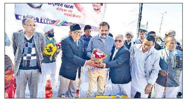
गोहाणा। यात्रा के दौरान बृजेंद्र सिंह का सम्मान प्रकट करते हुए।

■ पूर्व सांसद बृजेंद्र सिंह ने सद्भाव यात्रा के दौरान पत्रकारों से बातचीत की