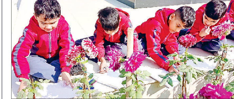
सोनीपत। शैडो ड्राइंग में हिस्सा लेते प्रतिभागी बच्चे।

कागज पर उत्तारकर सुंदर चित्र तैयार किए। यह देखकर शिक्षक और अभिभावक प्रभावित हुए कि बच्चे किस तरह अपनी कल्पनाशक्ति को सरल साधनों से कला में बदल रहे थे। इस अवसर पर शिक्षकों ने बच्चों को छाया का विज्ञान, प्रकाश की दिशा और आकारों के बदलने के बारे में आसान भाषा में जानकारी देकर सीखने को और रोचक बनाया।