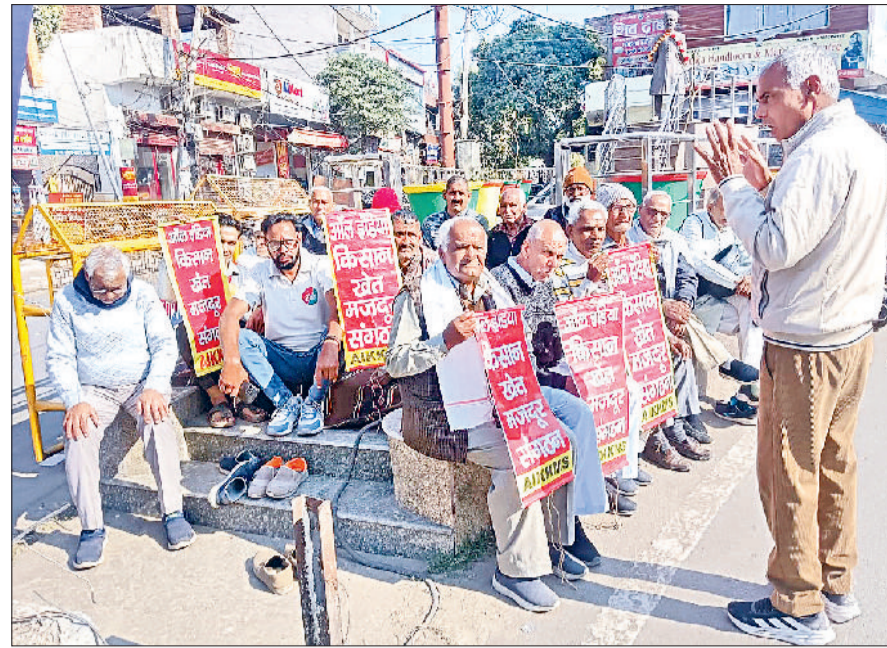
सोनीपत। छोटाराम चौक पर धरना देते संगठन के पदाधिकारी एवं सदस्यगण।